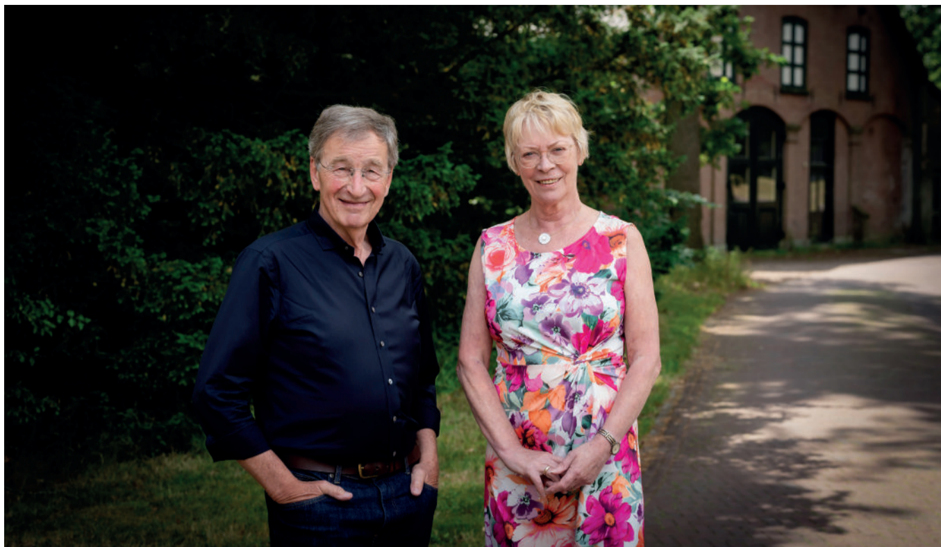
De bestuurswissel leidt niet tot grote koerswijzigingen, “eerder consistentie”.

Pieters Swildens draagt voorzitterschap over aan Trudy van den Berg