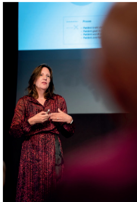
Vriendenbijeenkomst in Driebergen.