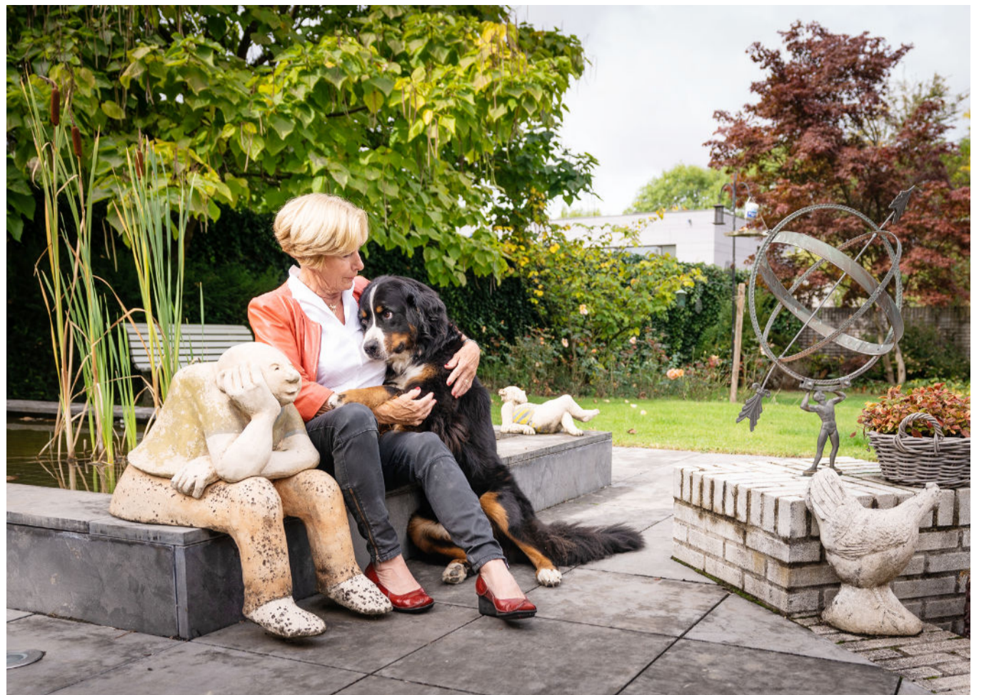
"Ik heb zoveel mogelijk scenario's beschreven waarin ik euthanasie wil."

De wet blijkt naar tevredenheid te functioneren. Artsen hebben er vertrouwen in. Dat blijkt ook uit de grote meldingsbereidheid. We hebben een uiterst zorgvuldige en transparante euthanasiepraktijk. Dat vind ik een grote verworvenheid."